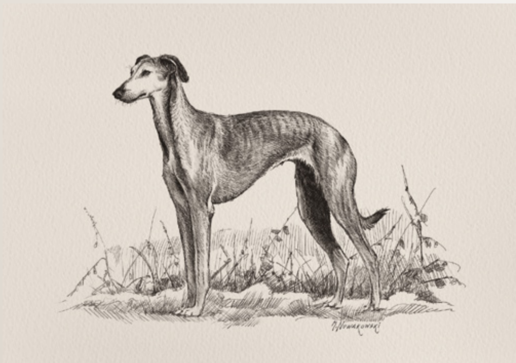
Rys. Michał Nowakowski, 2025.