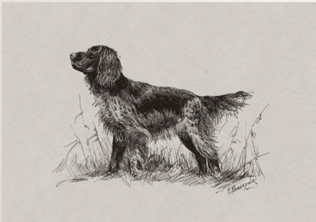
Rys. Michał Nowakowski, 2025.