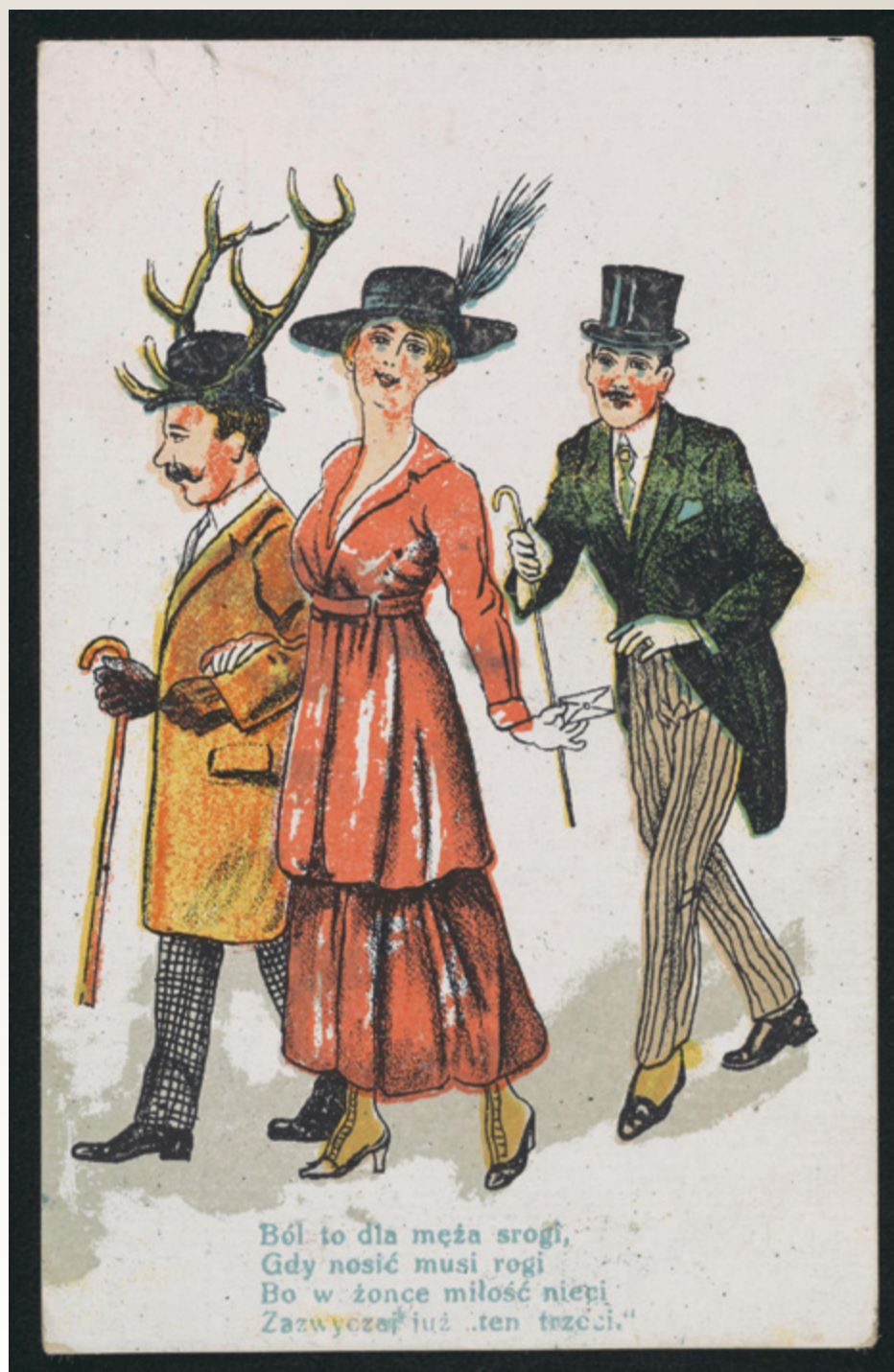
Pocztówka.

Koniec polowania. Uroczysty pokot, rzecz jasna dobrze obwąchany, po nim poczęstunek – również dla psa. Powrót do domu. W mojej głowie kotłowały się setki myśli. Zastanawiałem się, co zrobiłem dobrze, co mogłem lepiej, jak powinienem przygotowywać psa do sezonu. Lira w tym czasie zwinęła się pod siedzeniem pasażera, kładąc głowę koło lewarka i... spokojnie zasnęła. Wiedziała, że zrobiła dokładnie to co trzeba. Była psem spełnionym, spokojnym – współpracowała z innymi psami, szukała zwierzyny, goniła, słyszała strzały, zgubiła się i cudownie odnalazł ją przewodnik, było wyteżanie wszystkich zmysłów w pracy przy postrzałku. Po powrocie, gdy byliśmy już w domu znalazła siły na zabawę z moją czteroletnią córką. Wszechstronność Liry jest wspaniała! Nie był to łatwy dzień, jednak udało jej się to wszystko ogarnąć. Czyżby pokazała mi właśnie prawdziwy źródło słów nazwy ogar polski?