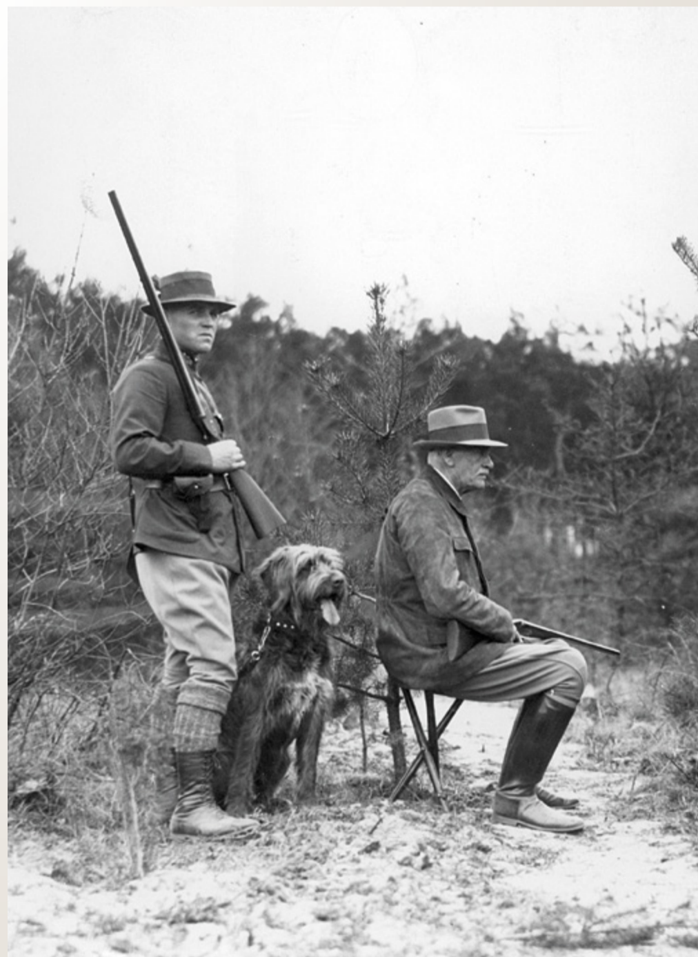
Prezydent RP Ignacy Mościcki ze strzelcem i gryfonem Lordem na polowaniu na kaczki, czerwiec 1934 r.

O popularności gryfonów w końcu XIX wieku możemy się dowiedzieć z kolejnego artykułu w „Łowcu” galicyjskim, opublikowanym w 1903 roku. Tym razem jest to głos anonimowego autora, odpowiadający na zapotrzebowanie na informacje o naszych bohaterach, przedrukowany z periodyku dolno-austriackiego towarzystwa łowieckiego. Zgadzał się on z poglą-