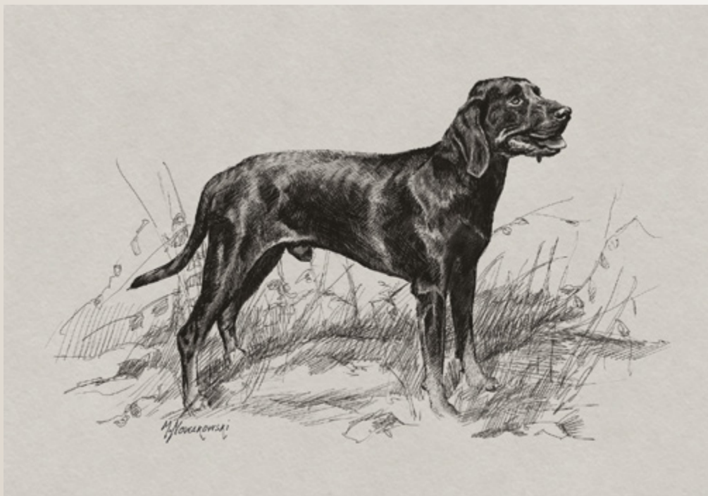
Rys. Michał Nowakowski, 2025.