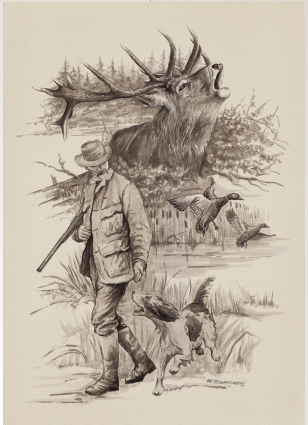
Rys. Michał Nowakowski, 2025.