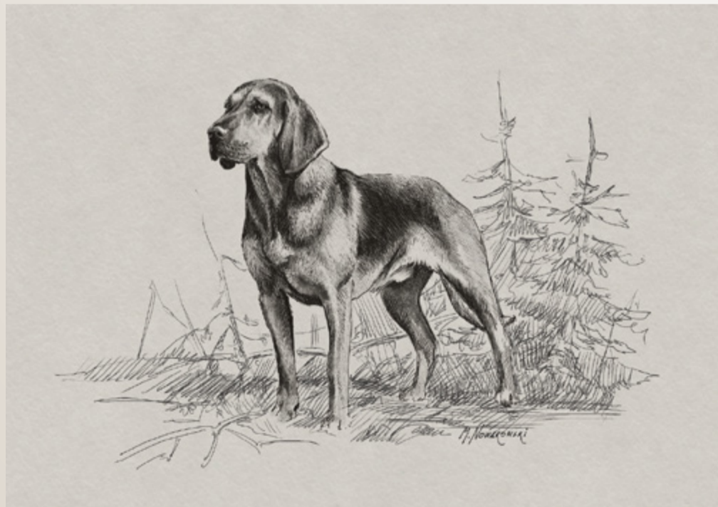
Rys. Michał Nowakowski, 2025.