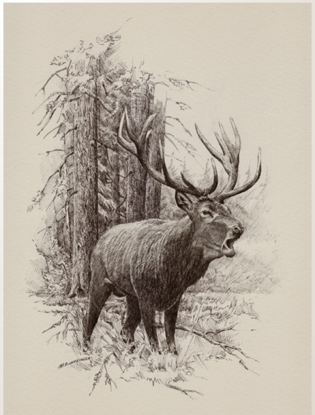
Rys. Michał Nowakowski, 2025.