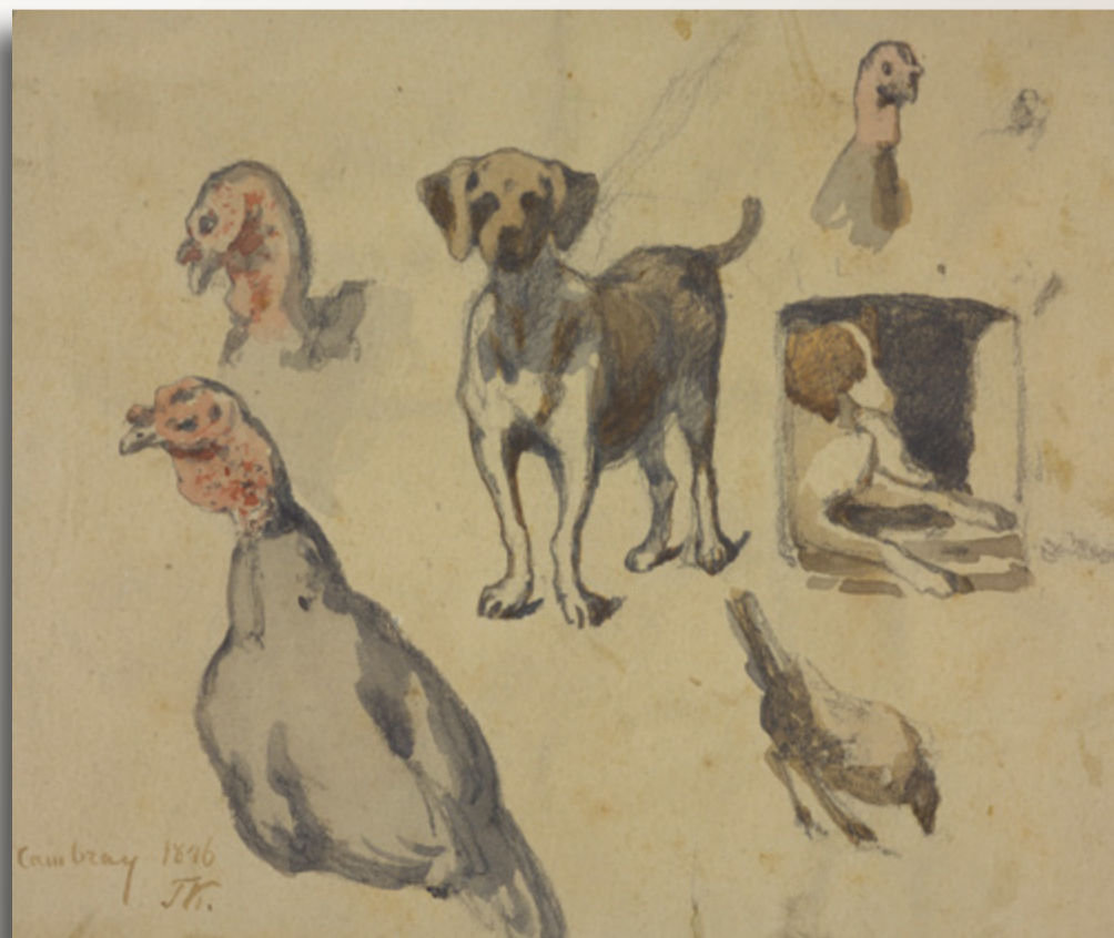
Pies i indyk, akwarela. Teofil Kwiatkowski, 1846.

Autor jest radcą prawnym w Zarządzie Głównym PZŁ oraz biegłym sądowym w zakresie gospodarki łowieckiej, wykonywania polowań oraz szacowania szkód łowieckich