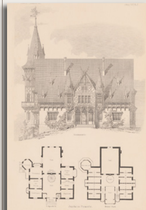
Oliver Pavelt, dom myśliwski w Promnicach (Jagdhaus Promnitz), 1872. Elewacja frontowa.

Tak wielki świat odcisnął swe piętno w architekturze miejsca. Promnice. Czuć było ten wysublimowany i dopracowany w detalach przepych. Miejsce sprzyjało kontemplacji.