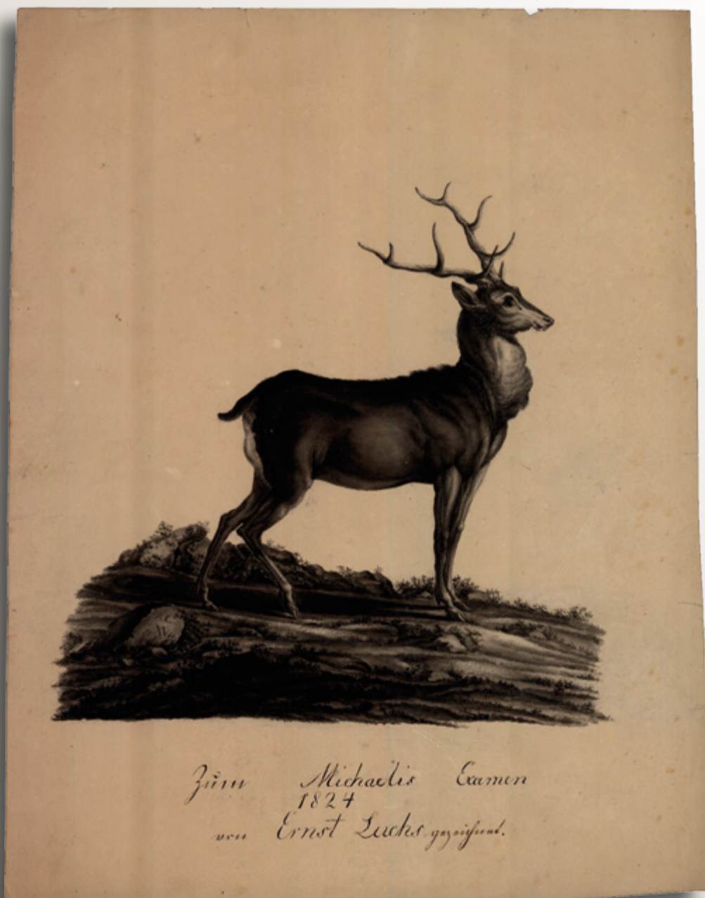
Rysunek tuszem. Jeleń, Ernst Luchs, 1824. Zbiory: Polona

Już nawet nie muszę dzisiaj nic upolować, bo tyle widziałam, tyle utrwaliłam w kadrze. A z drugiej strony, gdy widzę, gdzie bytuje interesujący mnie rogowiec, mogę opracować skuteczniejszą strategię podejścia go, gdy już nadejdzie różowy świt. I tak nudy ambonowe mogą stać się aktem twórczym, zabawą w obserwację, a tym samym lepszym poznaniem, co w tej trawie piszczy.