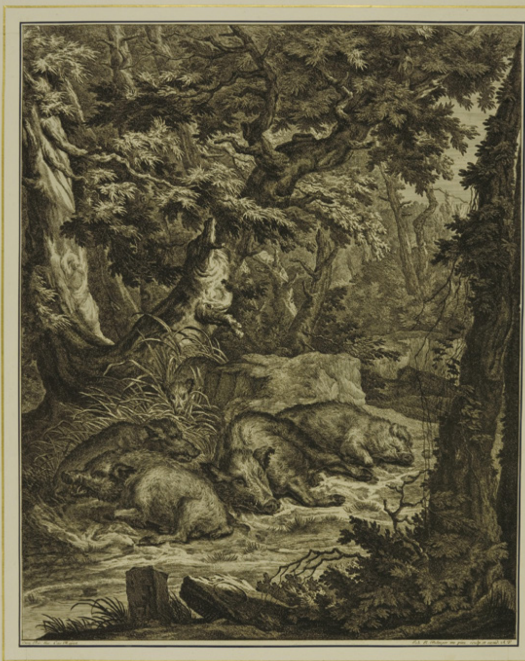
Dziki, grafika Johann Elias Ridinger, 1767.