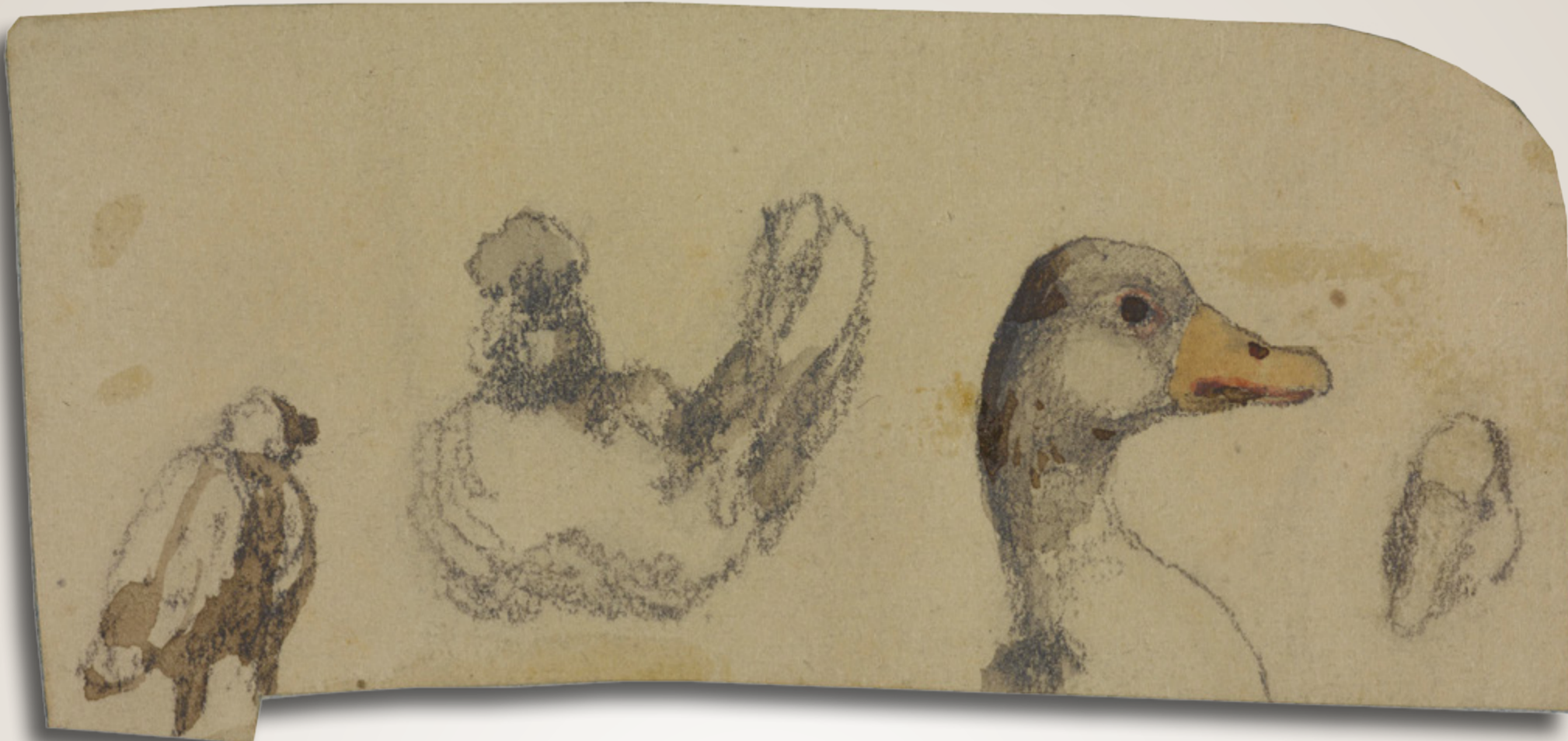
Głowa kaczki, akwarela. Teofil Kwiatkowski, 1846.

egzaminu. I wówczas po raz kolejny pokazuje się skutek nieprzestrzegania własnych procedur. Bo też skąd zarząd okręgowy ma wiedzieć czy staż został poprawnie przeprowadzony jeśli nie z zapisów w dzienniczku? Jeśli nie ma w nim potwierdzenia zrealizowania istotnych punktów szkolenia wówczas stażysty nie powinno się dopuścić do egzaminu, co dla stażysty byłoby absolutnie nie do przyjęcia i zniechęciło do łowiectwa w ogóle.